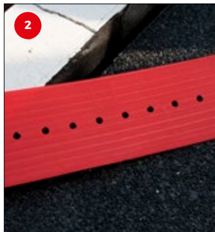
2 Pak een derdehandje en kies het gat dat zich voor de gegeven spouwsituatie het best leent. In de praktijk zal dit vaak een van de gaten in het midden zijn.