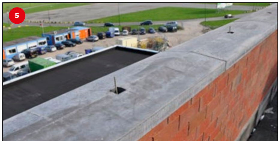
5 Door van tevoren alle draadeinden van derdehandjes te voorzien, kan het plaatsen van de afdekbands als een routinematig - en dus kostenbesparend - proces worden uitgevoerd.