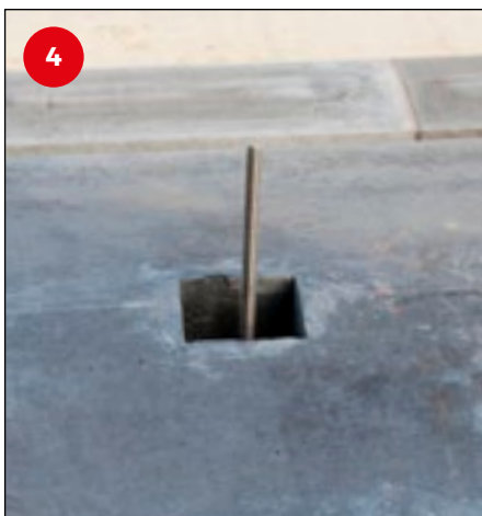
4 Positioneren en het op zijn plaats laten zakken van de afdekbands worden zo heel eenvoudig (de derdehandjes blijven gewoon zitten).